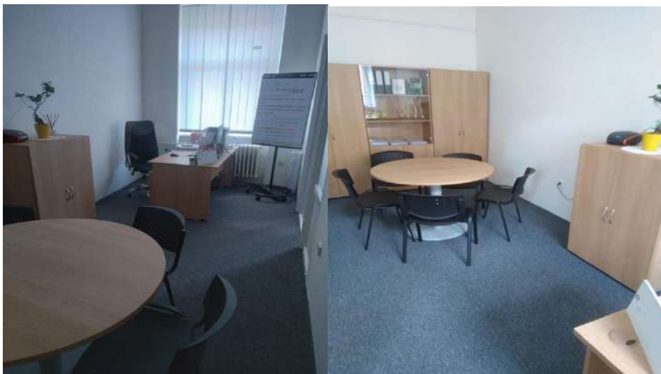
Obrázok č. 3

Kancelária „špecialistu pre trestnú mediáciu“ Okresný súd Ružomberok