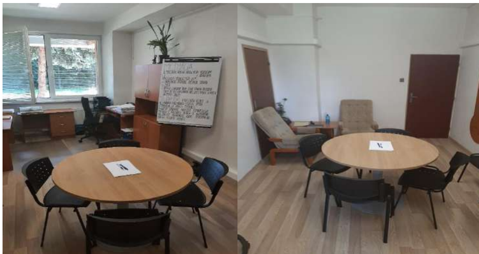
Obrázok č. 2

Kancelária „špecialistu pre trestnú mediáciu“ Okresný súd L. Mikuláš